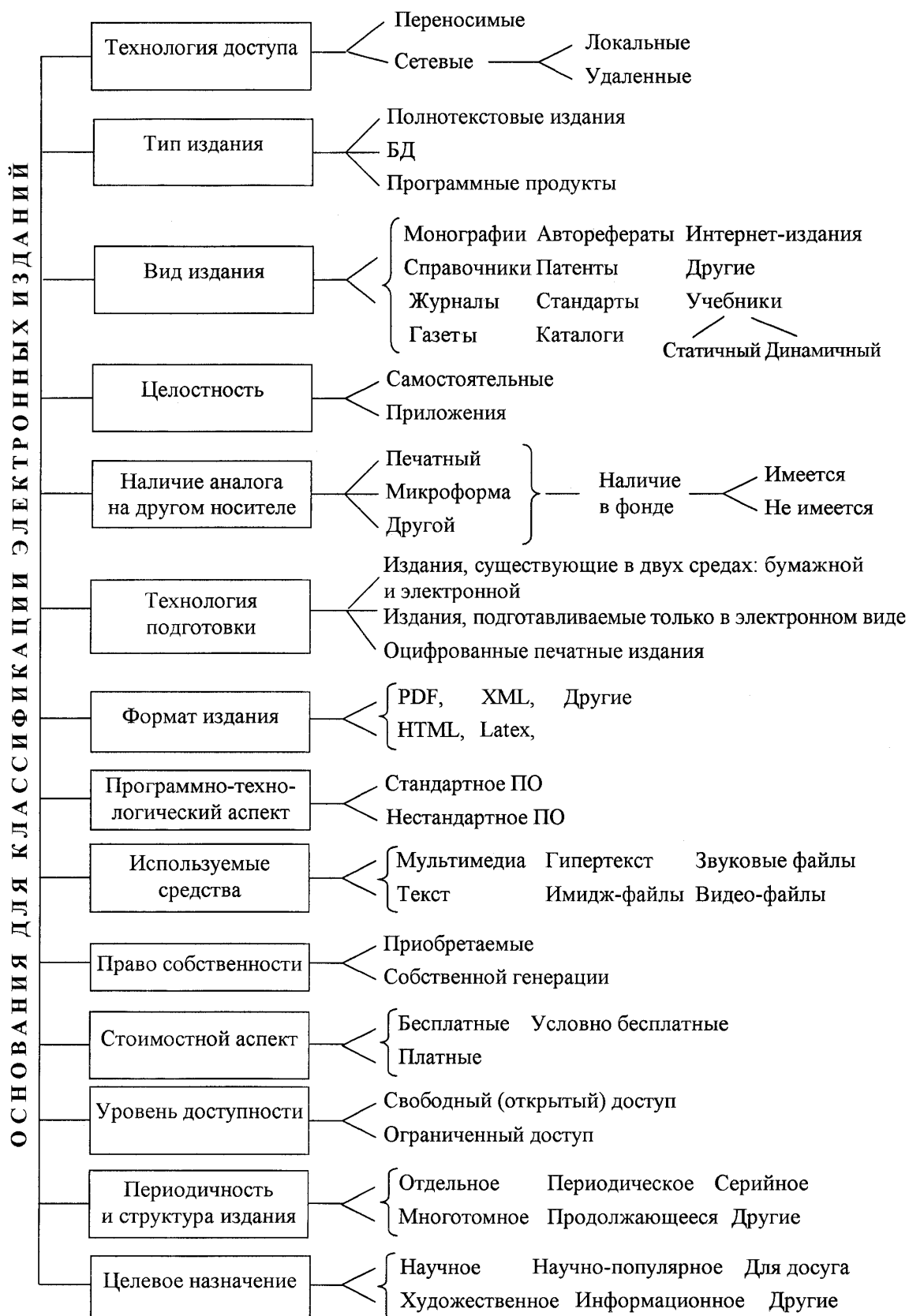
Рис. 1. Классификация электронных изданий.