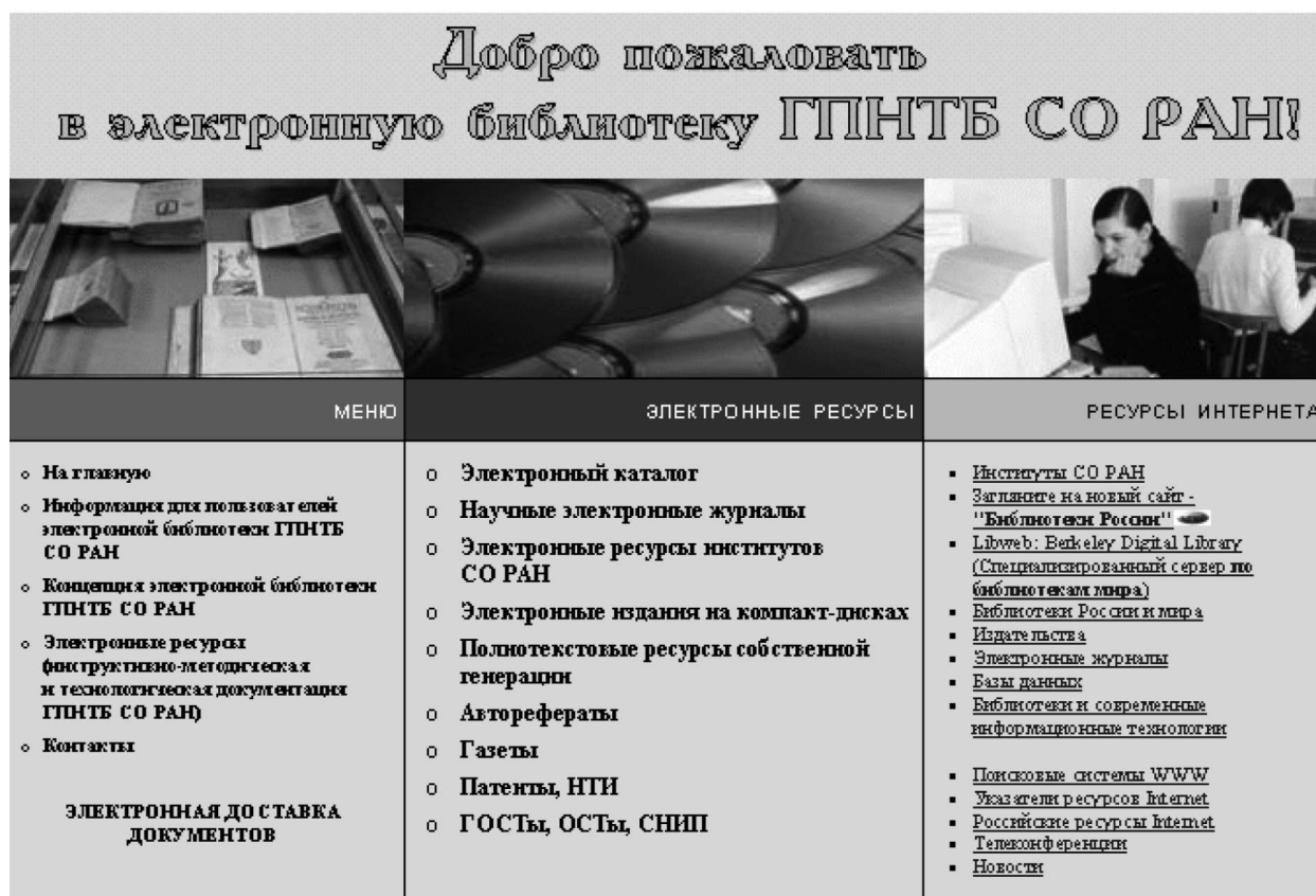
Рис. 2. Электронная библиотека ГПНТБ СО РАН.