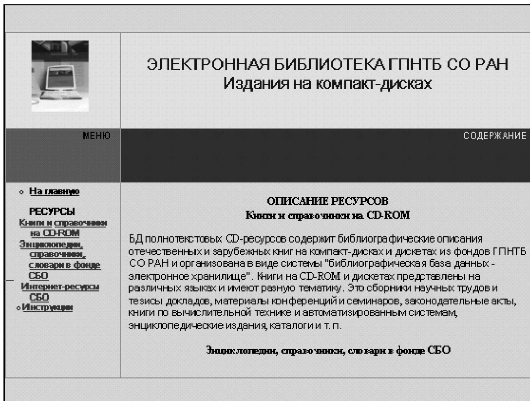
Рис. 4. Страница доступа к электронным изданиям на компакт-дисках.